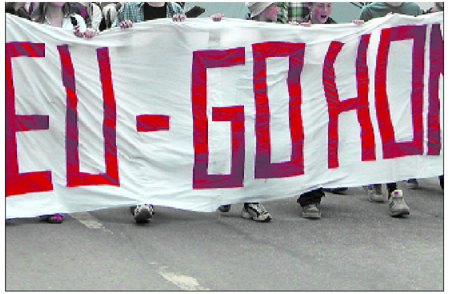
Demonstrationen i Nyköping under EU-utrikesministermötet var en av många protester under Sveriges ordförandeskap detta halvår.

Dit syftar inte EU. EU sluter portarna åt de flyktinghärder de själva skapat. Talande är att Jugoslavien och Irak toppade listan över länder varifrån människor sökt asyl i EU, länder som EU-bomber förstört och EU-sanktioner isolerat.