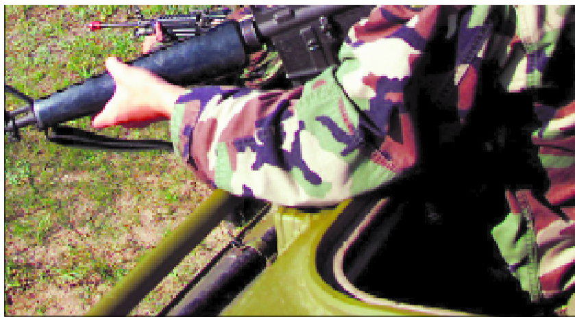
Under en Natostyrd övning i Ukraina förra året agerade svenska soldater lokalbefolkning som trakasserade amerikanska soldater.

Kampen mot svenska kärnvapen – som statsminister Erlander ville ha – var en av 50-talets största politiska frågor. Då föll projektet på det omfattande folkliga motståndet. Med EU:s militarisering blir Sverige nu en del av en kärnvapenutrustad militärmakt.