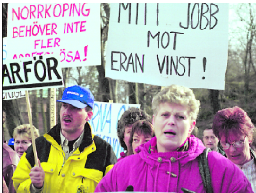
Erikssonanställda mot markandens diktatur.