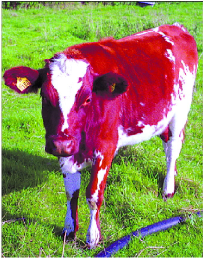
Galna? Det är väl dom där som lider av "Stora trut-sjukan"?

Ett upprop som kräver att EU återtar sitt förslag om en ny omfattande förhandlingsrunda har initierats av internationella Jordens Vänner: www.mjv.se