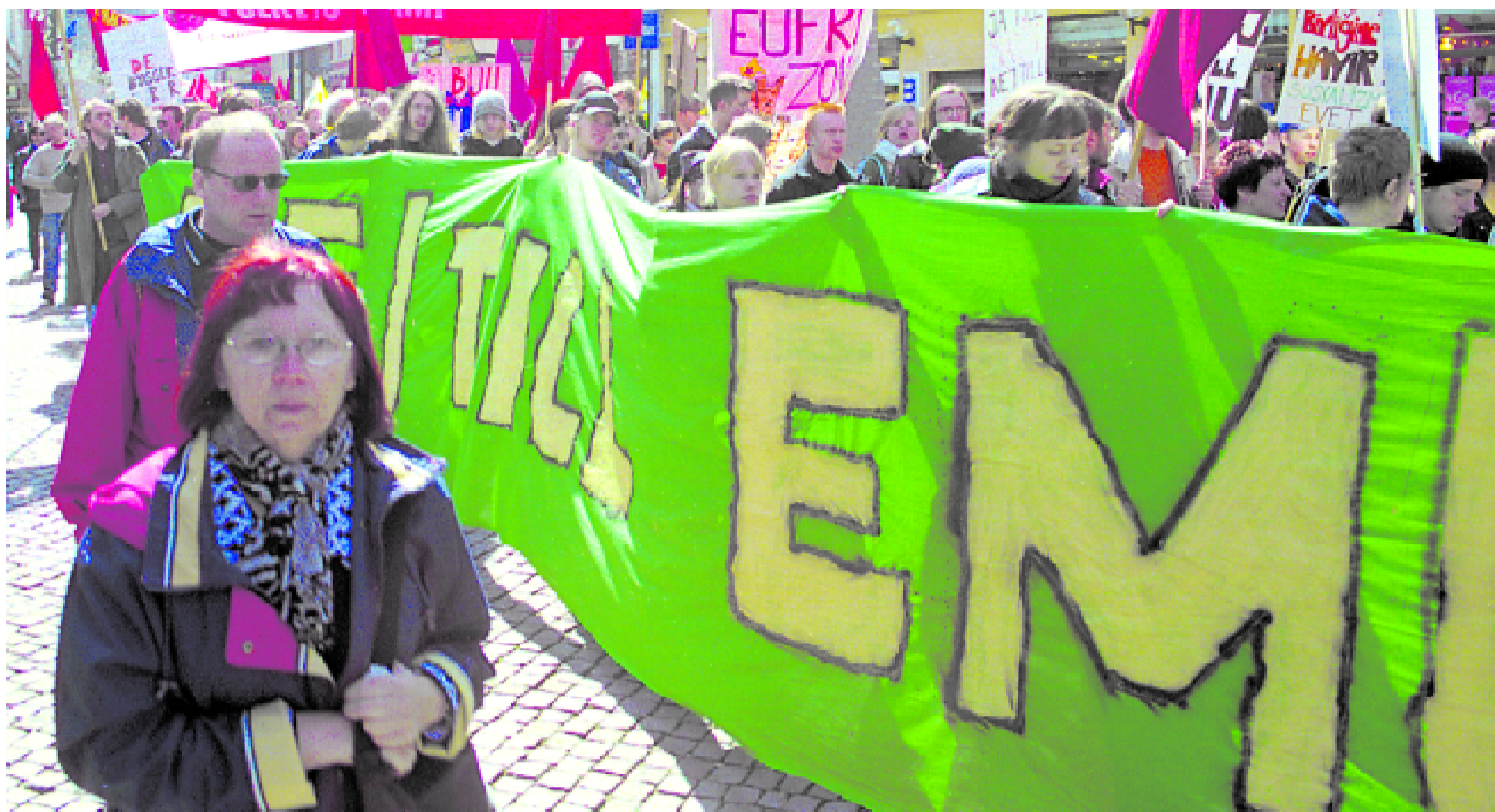
Malmö i april: genrep inför protestdagarna mot EU:s nyliberala politik den 15 - 16 juni i Göteborg- slut upp!